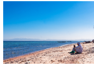
Foto actual del mar Rojo